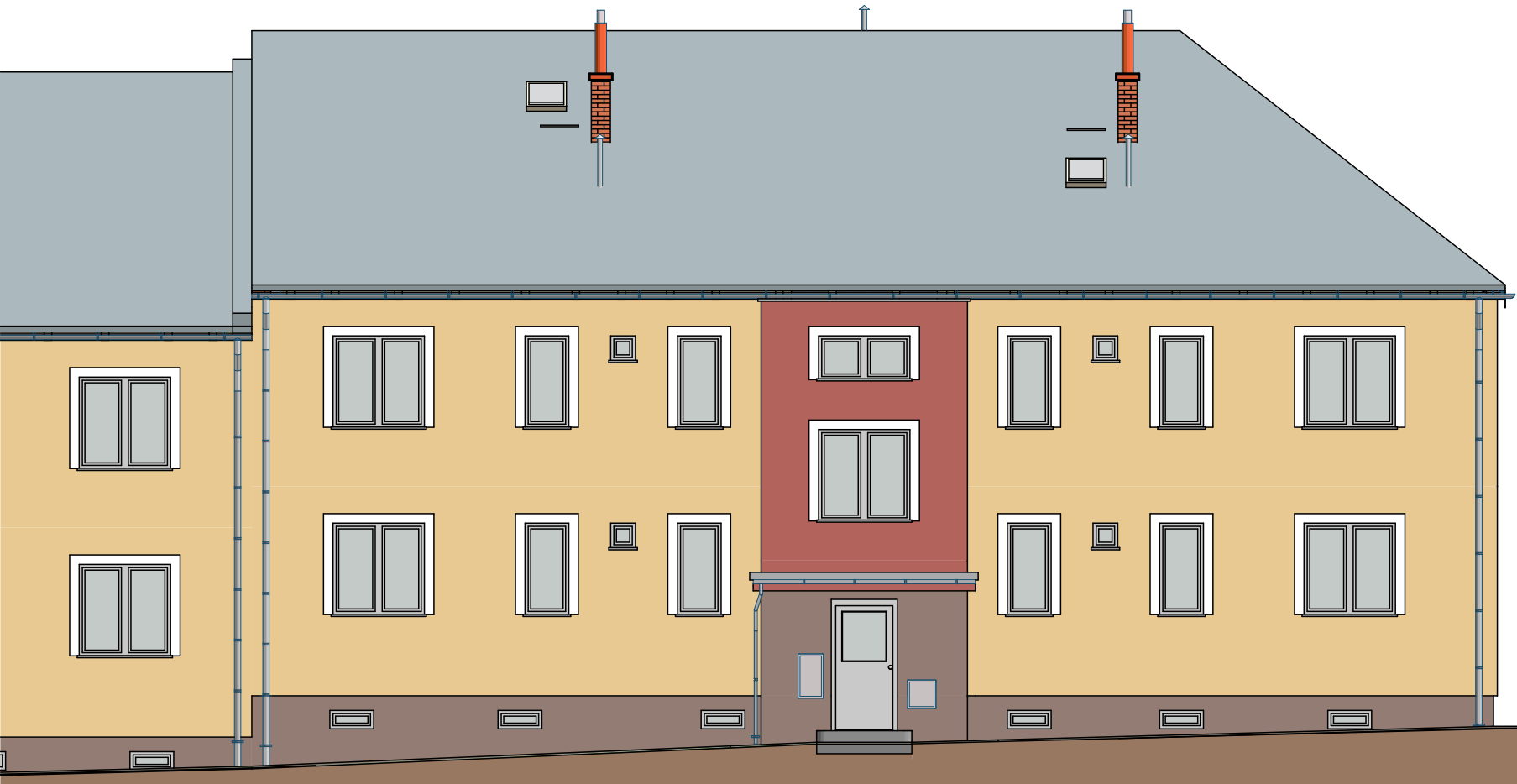
Pohled severníBarevné řešení1:100